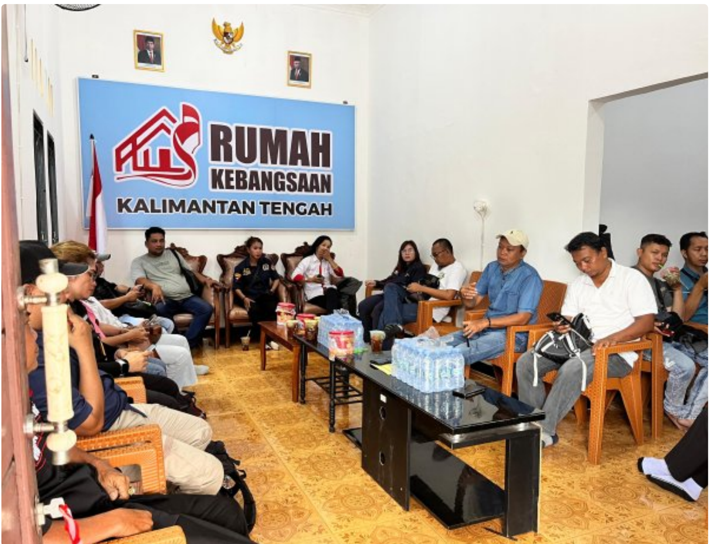
Gambar: Acara Ramah Tamah di Rumah Kebangsaan Kalteng

PALANGKA RAYA - Pelaksanaan pemilihan kepala daerah (Pilkada) yang akan dilaksanakan secara serentak di seluruh wilayah Republik Indonesia, tahun 2024 ini.